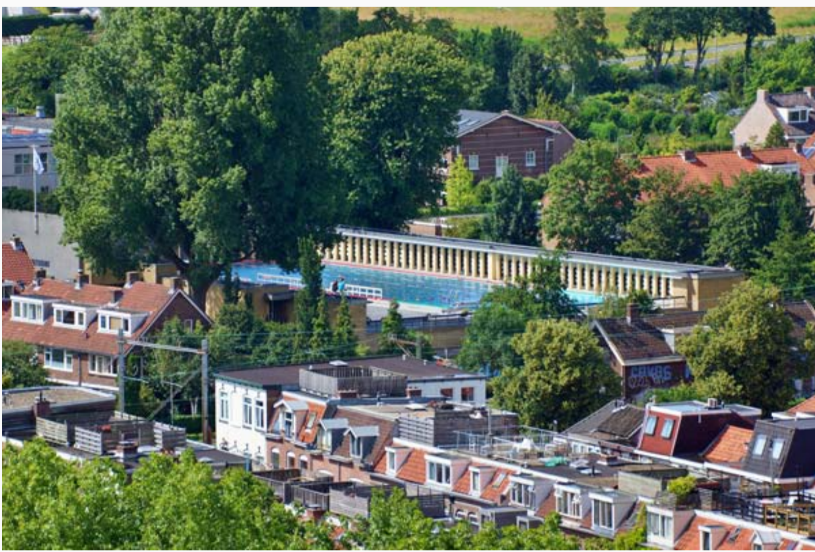
En de blik vanaf de Kathedraal!