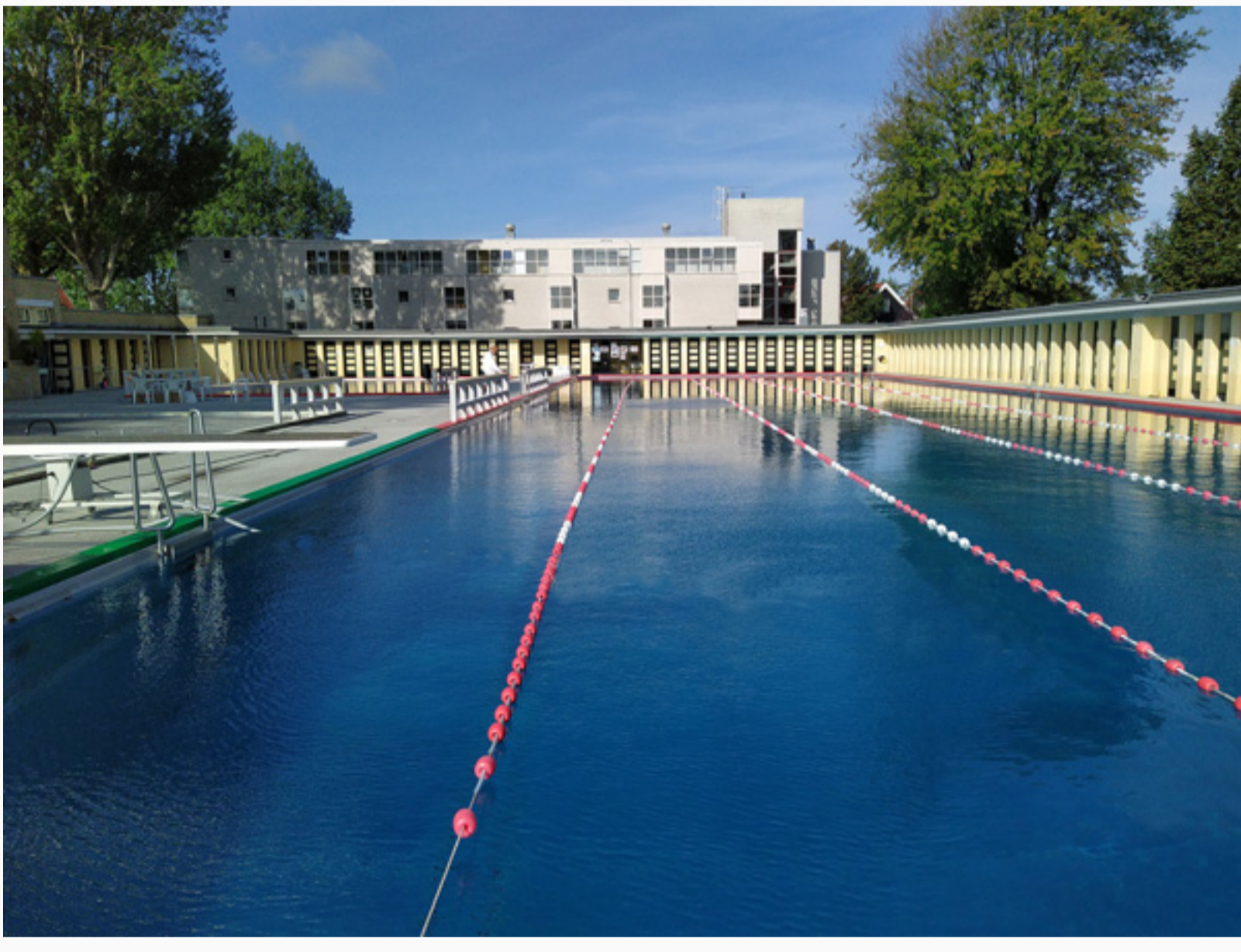
Rust, ruimte en strakke belijning.