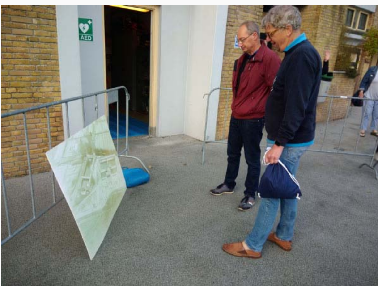
13 september 8.00 uur Monumentendag begon al vroeg!

Het karakter van de dag was hemelsbreed verschillend van vorig jaar. Dit jaar rust en gemotiveerde bezoekers, die duidelijk een keuze voor de Houtvaart hadden gemaakt. Er waren zelfs bezoekers uit Rotterdam! Toelichtingen en het informatiemateriaal zijn zeker gewaardeerd. Sommige bezoekers hebben ook foto's nagestuurd, waarbij de rust en de strakke lijnen van de Houtvaart prachtig naar voren komen. Een speciale fotoreportage van deze dag met de titel: "De Houtvaart. Een monument in Corona-tijd" van Eric Oudendijk treft u hier aan. En er zijn weer wat Vriendenzwemmers bijgekomen!